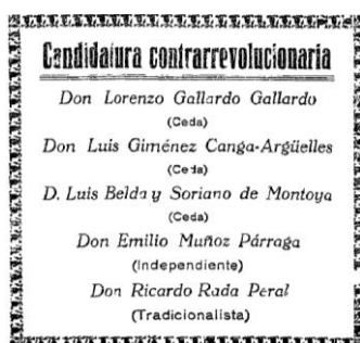
Imagen 1.- Anuncio aparecido en La Independencia del 7 de febrero de 1936 y otros días