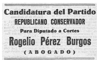
Imagen 4.- Anuncio aparecido en La Crónica Meridional el 7 de febrero de 1936

El programa con el que se presentó el Frente Popular, hecho público el 15 de enero, era relativamente moderado. En él se afirmaba que solo gobernarían los republicanos; que no se produciría la nacionalización de la tierra ni la de la banca; que las expropiaciones que se produjeran lo serían mediante oportunas y justas indemnizaciones; que se tomarían medidas para organizar la producción industrial, el mejoramiento del nivel de vida, la redención del campesino y del agricultor mediano y pequeño; extensión e intensificación de la enseñanza primaria para terminar con la lacra del analfabetismo; restablecimiento de las garantías constitucionales potenciando el principio de autoridad y garantizando el orden público; amnistía para delitos políticos y sociales, en especial, para los cometidos durante la revolución de octubre de 1934 9 .