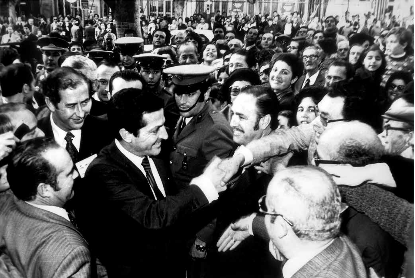
C&amp;T Editores / Centro de Estudios Andaluces.