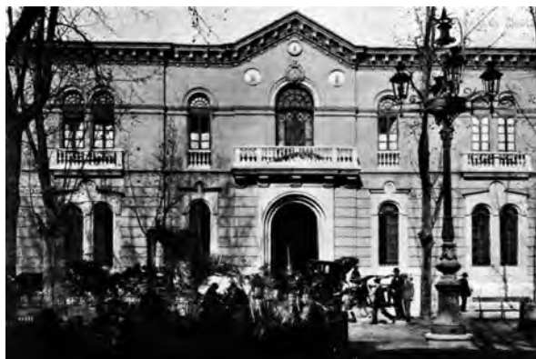
Palacio episcopal, sede del Gobierno Civil durante la guerra.

fue muy escasa. Entre otras acciones, se embalaron pinturas y fueron enviadas a Valencia, lo que provocó la protesta de algunos miembros de la Junta que consideraban que el destino final de los cuadros sería la venta en el extranjero. Esa fue la razón por la que uno de las obras de más valor, la Purísima Concepción de la catedral, atribuida erróneamente a Murillo, se quedó en el Palacio Episcopal, convertido en sede del Gobierno Civil desde los primeros días de la guerra 104 .