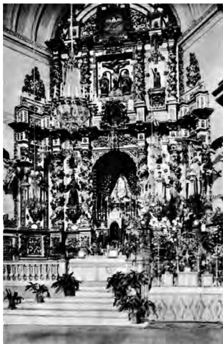
Retablo de la iglesia de Santo Domingo, quemado en julio de 1936.

En ocasiones, la violencia popular respondía a una ira ciega dirigida contra el clero más que contra la propia religión o el sentimiento religioso. El escritor inglés Laurie Lee, que vivió el comienzo de la guerra en Almuñécar, cuenta que antes de que estallara la sublevación los pescadores quemaron la iglesia. Una semana después, cuando llegó el día de la Patrona, los mismos pescadores sacaron a hombros en procesión las imágenes que habían sobrevivido al incendio 66 .