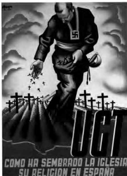
Cartel anticlerical de la UGT.

En general, se ha achacado a elementos anarquistas la mayor furia anticlerical, aunque republicanos, socialistas y comunistas compartieron la animadversión hacia la Iglesia. La FAI, decidida partidaria de la insurrección revolucionaria, situó a la Iglesia como uno de los principales objetivos en sus acciones de sabotaje, con las que intentaban reforzar las huelgas. Y no menos cleróforas fueron las Juventudes Libertarias que ya en su congreso fundacional consideraban a