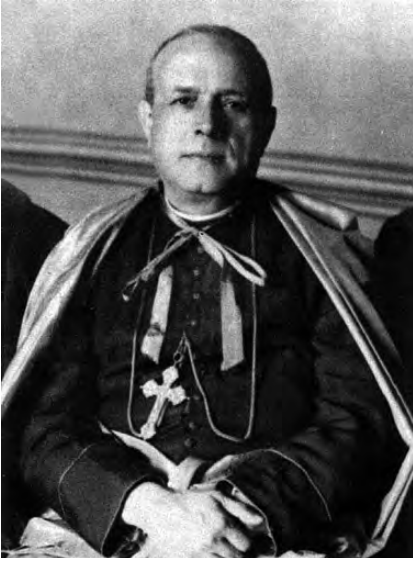
El obispo Diego Ventaja.