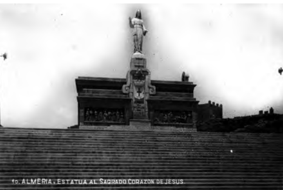
10. ALMERÍA. ESTATUA AL SAGRADO CORAZÓN DE JESÚS, destruida en julio de 1936.

lo que no dudaron en romper las puertas del centro 27 .