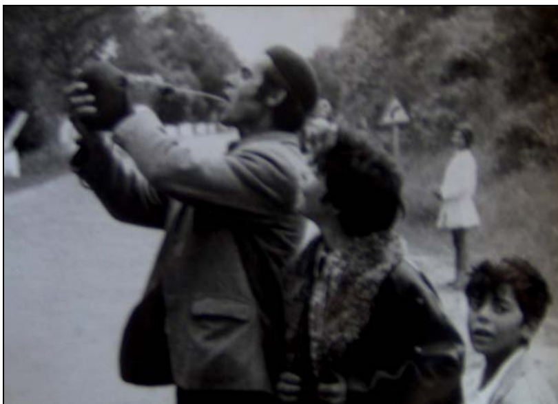
Ilustración 1: Jornaleros en Jaén

En el ámbito socioeconómico, Jaén era una provincia marginada. Faltaban viviendas e infraestructuras (comunicaciones, suministro eléctrico), y el agua disponible no era suficiente para el abastecimiento de la población. El estado deficitario de los barrios pronto comenzó a ser denunciado por recién creadas asociaciones de vecinos, tales como la del «Passo» o la de Peñamefecit-Gran Eje.