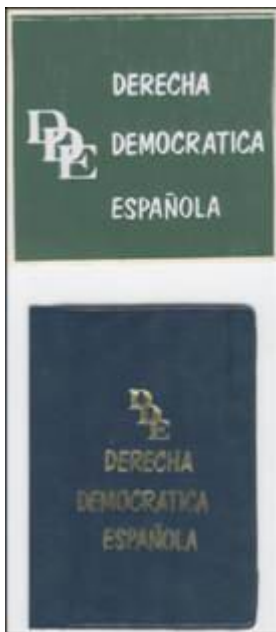
Propaganda del partido

La campaña de concienciación para el entendimiento de la derecha en una gran coalición vino acompañado de la organización de diversas actividades para que el partido se fuese conociendo.